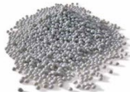
Plasten bliver smeltet og formet til flager