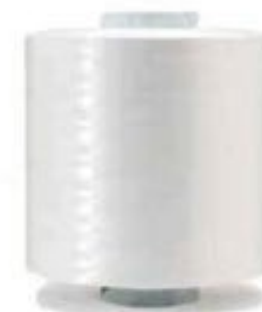
Flagerne bliver omdannet til 100% recirkuleret garn.