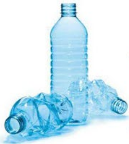
Brugte plastflasker klar til genbrug.