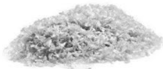
Plasten bliver hakket i små bidder.